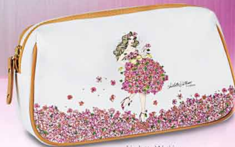
Liselotte Watkins Kosmetyczka Wymiary: 22 x 8 x 12,5 cm 22205