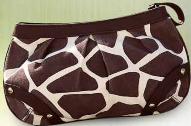
Savannah Kosmetyczka Wymiary: 22 x 15 cm 20715

Materiał: brezent, PVC, płótno, żelazo, stop cynku, poliester, nylon.